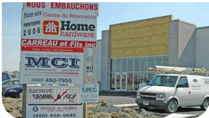
La dernière phase des travaux de construction suit son cours normalement et devrait permettre l'ouverture du Centre de rénovation Carreau et Fils inc., au cours du mois de mai.

Le magasin qui devrait ouvrir ses portes au mois de mai occupera 25 000 pieds carrés tandis que l'entrepôt, situé dans un bâtiment adjacent, comptera 10 000 pieds carrés. Tout un chemin parcouru pour l'entreprise qui a vu le jour à Mariville en 1908.